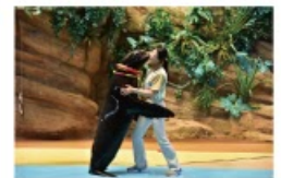
遠い昔から一緒だった 海からのやさしい贈り物に出会う