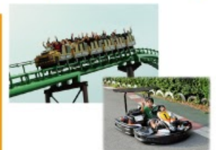
型にこだわらない遊びがまっている