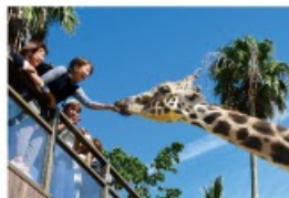
野生を感じる、自然からの 熱いメッセージに耳を傾ける、ひととき