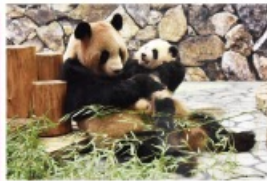
新たな出会いと感動の空間 パンダファミリーに感動の大接近